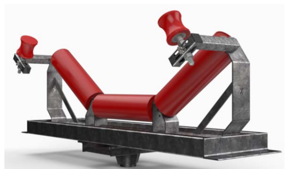
Серия K-Commander® Direct TR HD Inline