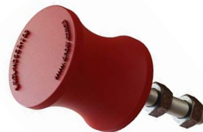
Конвейерный вспомогательный ролик с боковой направляющей из полиуретана K-HD.