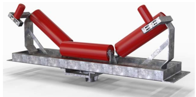
Серия K-Commander® Direct TR SD.