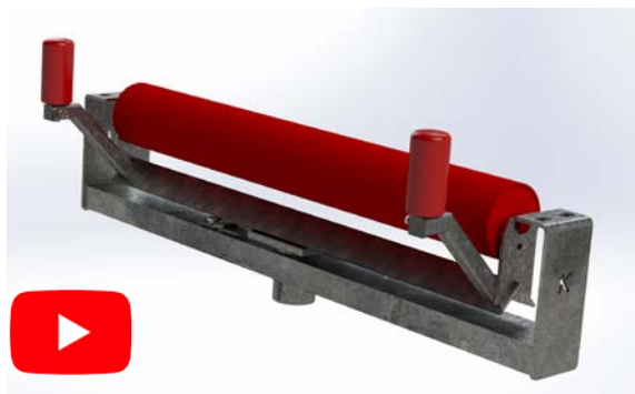
Серия K-Commander® Direct R.

Вспомогательный ролик с боковой направляющей из полиуретана SD.