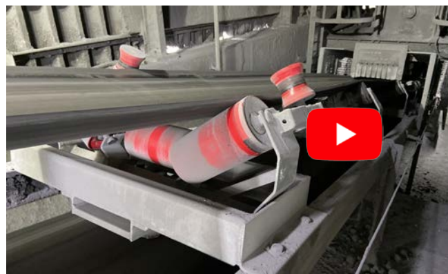
Серия K-Commander® Direct TR.

ТОО Флоу Энерджи +7701-419-02-13 astana@flowenergy.kz flowenergy.kz