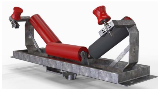
Серия K-Commander® Direct TR HD Вспомогательный ролик, показанный как опция с резиновой обшивкой.