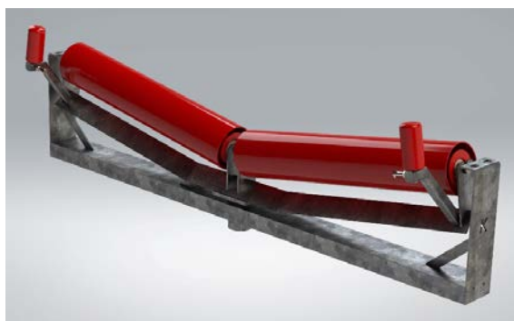
Серия K-Commander® Direct VR SD Vee Return Tracking Frame